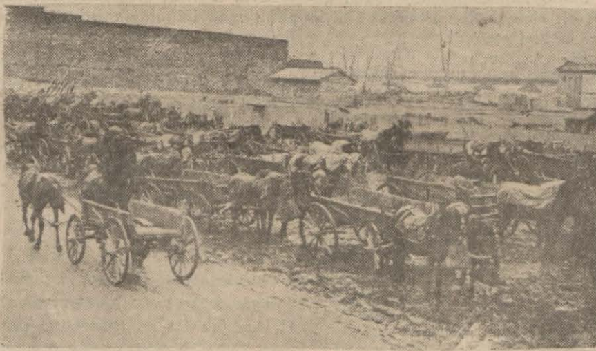
Muhtelif tiplerde arabalardan bir grup

Hükûmet yurdun coğrafi ve halkın mali vaziyeti ve mevcut ihtiyaçları uzun uzadıya tetkik ederek tek ve çift dingilli olmak üzere ucuz ve kullanışlı iki araba tipi meydana getirmiştir. Bu tiplerin nümunesi ve plânları, Dahiliye, Ziraat ve Millî Müdafaa Vekâletleri tarafından tetkik ve tecrübeleri yapıldıktan sonra muvafık görülmüştür. Yeni kararlar memleketteki muhtelif cins arabalar peyderpey ortadan kaldırılabilecektir. Karabük demir ve çelik fabrikaları yeni tip arabalar için icab eden demir aksamları seri halinde yapacak ve bunları ucuz fiyatlara satacaklardır. Kararın tatbikatını temin için Ziraat Vekâletinin halka kredi ile vermekte olduğu arabalar yeni tiplerden olacak, bilümmün devlet müesseseleri, yarı resmî müesseseler, yol işleri müteahhidleri yeni tip arabaları kullanmağa mecbur