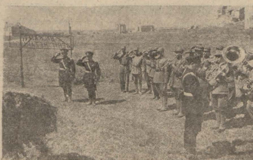
30 Ağustos Zafer bayramı günü Edirne'de «Balkan şehidliği» nde yapılan merasim. Ordu namına şehidliğe bir çelenk konmuş ve şehidimizin ruhları taziz edilmiştir. Resmimiz bu merasimden bir intibaı tesbit ediyor.