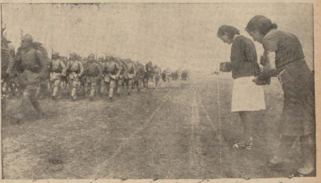
Edirnedeki Zafer bayramı merasiminden üç intiba: Solda Korgeneral Mustafa Muğlalı kutaatı teftiş ediyor, ortada geçid resminde hazır bulunan Bulgar hudud komutanı generallerimizle selâmlaşıyor, sağda kahraman piyadelerimiz geçid resminde

Almanlar Polonya - Sovyet hududuna asker tahşid ediyorlar Viyana konferansına aid ifşaat Romanya matem içinde